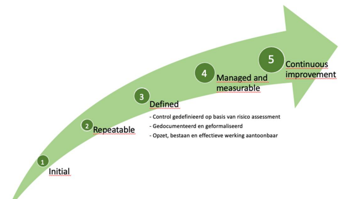
Figuur 1: Volwassenheidsniveau informatiebeveiliging

Naar verwachting worden de normen aangescherpt om externe en interne dreigingen het hoofd te kunnen bieden.